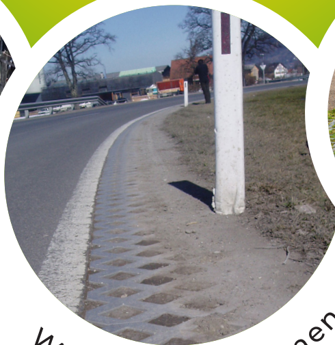
Wegkanten & bermen